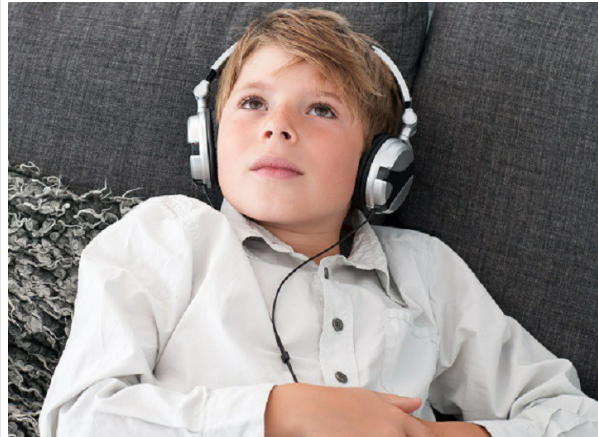
Symbobild wie Hörspiele Kinder schlau machen

„Du hörst nicht richtig zu“, halten wir unserem Nachwuchs gerne vor. Dabei ist Zuhören kein Urinstinkt, sondern muss gelernt werden. Geeignete Hörspiele helfen, Empathie und Wortschatz zu verbessern sowie Konflikte leichter zu lösen.